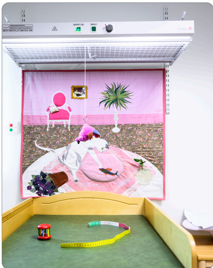
Медсестра вас измерит